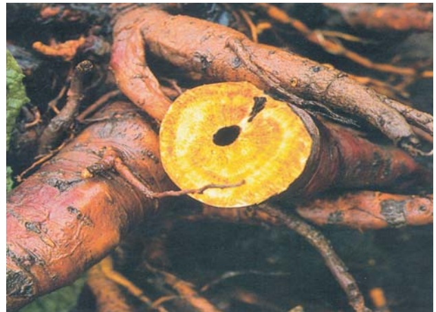
Abb. 2: Der Extrakt wird aus den Wurzelstöcken gewonnen, die aus kontrolliertem Anbau stammen. Die Abb. zeigt frisch ausgegrabene Wurzeln des Rhapontikrhabarbers.

Mit Phyto-Strol ® sicher und unbeschwert durch die Wechseljahre