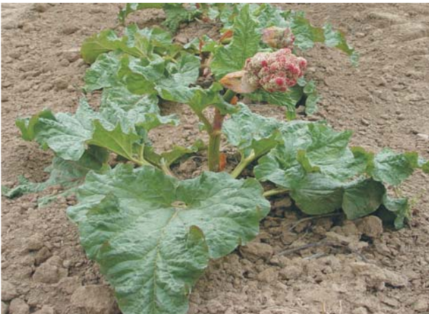
Abb. 1: Blühender Rhapontikrhabarber ( Rheum rhaponticum ).

In einem patentierten Extraktions- und Reinigungsverfahren wird ein alkoholfreier Trockenextrakt gewonnen, der die Herstellung gut verträglicher Tabletten mit einem konstanten Wirkstoffgehalt ermöglicht.