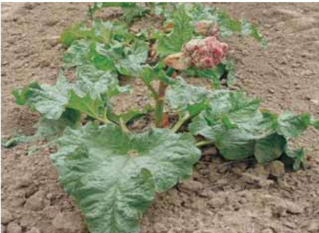
Abb. 1: Blühender Rhapontikrhabarber ( Rheum raphanicum ).

In einem patentierten Extraktions- und Reinigungsverfahren wird ein alkoholfreier Trockenextrakt gewonnen, der die Herstellung gut verträglicher Tabletten mit einem konstanten Wirkstoffgehalt ermöglicht.