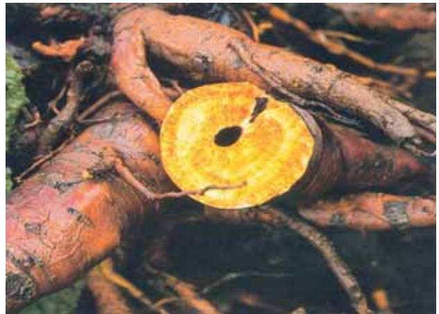
Abb. 2: Der Extrakt wird aus den Wurzelstöcken gewonnen, die aus kontrolliertem Anbau stammen. Die Abb. zeigt frisch ausgegrabene Wurzeln des Rhapontikrhabarbers.

Mit Phyto-Strol ® compact sicher und unbeschwert durch die Wechseljahre